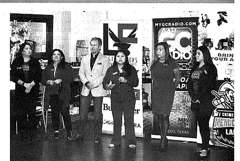
El sábado 21 de enero, será el Menudo Bowl en LIFE Downs.

La edición anual 27 de Menudo Bowl, es el evento recaudatorio que será el 21 de enero en LIFE Downs por parte de la organización civil sin fines de lucro, Laredo Crime Stoppers, que ayuda a la Policía de Laredo a combatir el delito en la ciudad, brindando recompensa en efecti-